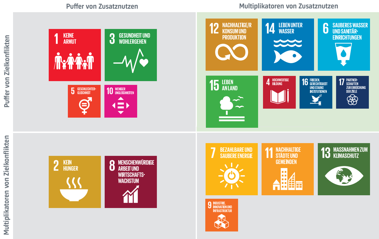
Abbildung 3: Wechselwirkungen von einem zum anderen SDG können synergetisch ( Zusatznutzen ) oder konflikthaft ( Zielkonflikt ) sein. Einige SDGs tendieren dazu, den Fortschritt bei anderen Zielen systematisch – positiv oder negativ – zu beeinflussen ( Multiplikatoren ), während einige andere dazu tendieren, durch den Fortschritt bei anderen Zielen systematisch – positiv oder negativ – beeinflusst zu werden ( Puffer ). Die Netzwerkanalyse des aktuellen Wissensstandes zu SDG-Wechselwirkungen zeigt, dass die Umsetzung von Massnahmen zur Erreichung der SDGs, die sich auf natürliche Ressourcen beziehen (SDG 6 Sauberes Wasser, SDG 12 Verantwortungsvoller Konsum, SDG 14 Leben unter Wasser und SDG 15 Leben an Land), mit hoher Wahrscheinlichkeit zur Erreichung anderer SDGs beitragen (im Kasten oben rechts Multiplikatoren der Zusatznutzen ). Die Grösse des SDG-Symbols (gross/klein) zeigt den Einfluss des jeweiligen SDGs auf andere SDGs. Die Abbildung wurde angepasst nach Pham-Truffert et al (2020). 9